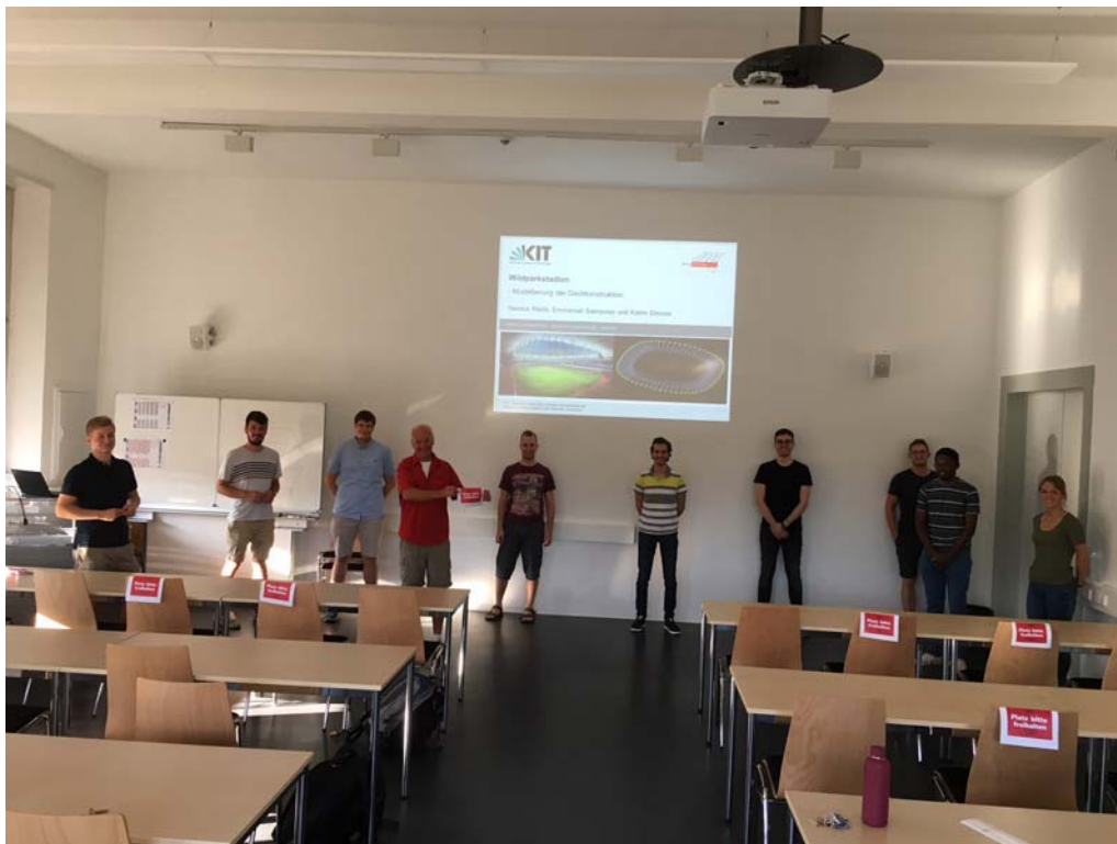
Teilnehmer des Seminars am 15. September 2020

Die Studierenden sollten hierfür interessante Projekte aus der Baupraxis mit gängiger Baustatik-Software modellieren. Hierbei sollte das Tragverhalten der Struktur untersucht und die Ergebnisse der Berechnungen interpretiert werden. In den Vorträgen wurde die Vorgehensweise bei der Modellierung geschildert und Probleme bei der numerischen Umsetzung diskutiert. In einer anschließenden Diskussionsrunde musste die Vorgehensweise verteidigt und weiterführenden Fragen beantwortet werden.